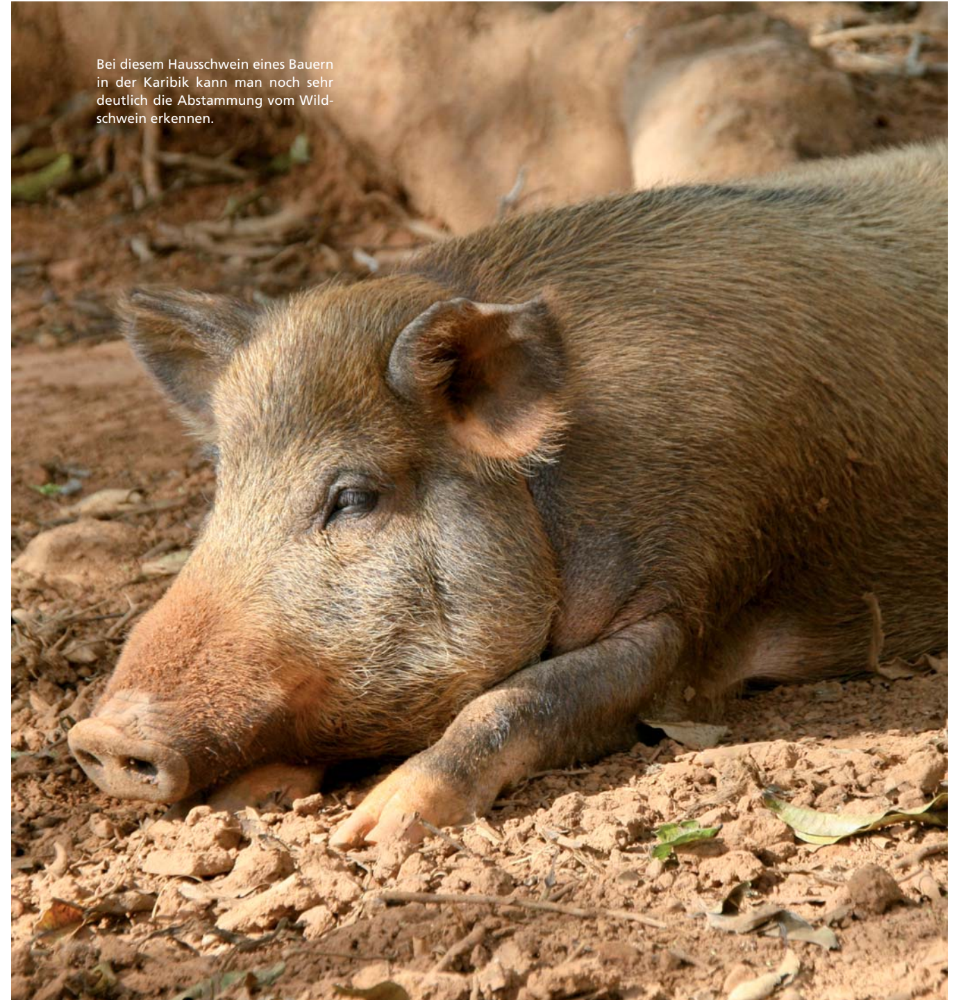
Bei diesem Hausschwein eines Bauern in der Karibik kann man noch sehr deutlich die Abstammung vom Wildschwein erkennen.

Für den Gourmet ist Schweinefleisch bisher nicht die erste Wahl gewesen. Auf den Speisekarten deutscher Sterne-Restaurants war von Ausnahmen abgesehen Schweinefleisch nicht zu finden. Die hochgezüchteten fettfreien Hybride haben zwar für den Züchter einen optimalen Ertragswert – da darf es auch einmal das eine oder andere Kotlett mehr sein – als es die ursprünglichen Schweinerassen vorsehen, aber auf der Strecke geblieben ist dabei das Genusserelebnis, insbesondere Saftigkeit und Geschmack. Nichts desto trotz erlebt Schweinefleisch seit mehreren Jahren in der Spitzengastronomie eine Renaissance. Zum einen haben sich deutsche Vermarkter für ursprüngliche regionale Schweinerassen wie das Bunte-Bentheimer oder das Schwäbisch-Hällische gefunden, zum anderen wurde das schwarze Ibérico-Schwein aus Spanien in Deutschland entdeckt. Diese alten Rassen weisen alle die Fähigkeit auf, intramuskuläres Fett zu bilden und so dem Fleisch Zartheit und Saftigkeit zu geben. Darüber hinaus werden die Ibérico-Schweine aus der Dehesa, einem riesigen Korkeicheengebiet im Südwesten Spaniens, traditionell extensiv gehalten und in der Endmast mit Eicheln gefüttert. So erhält das Fleisch einen angenehmen nussigen Geschmack, wie ihn sehr wahrscheinlich unsere Vorfahren vor 200 Jahren kannten. Die Farbe ist kräftig rot, und das Fleisch erinnert vom Ansehen eher an Rindfleisch als an uns bekanntes hellrosa Schweinefleisch.