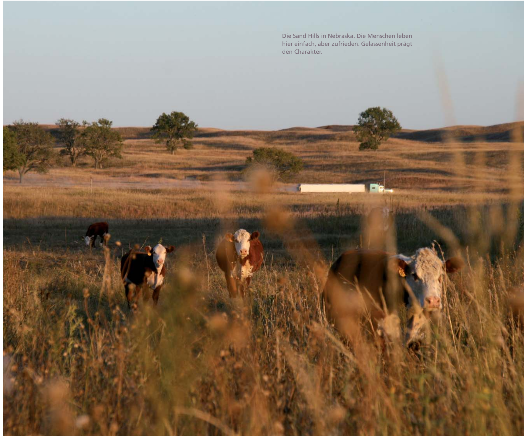
Die Sand Hills in Nebraska. Die Menschen leben hier einfach, aber zufrieden. Gelassenheit prägt den Charakter.