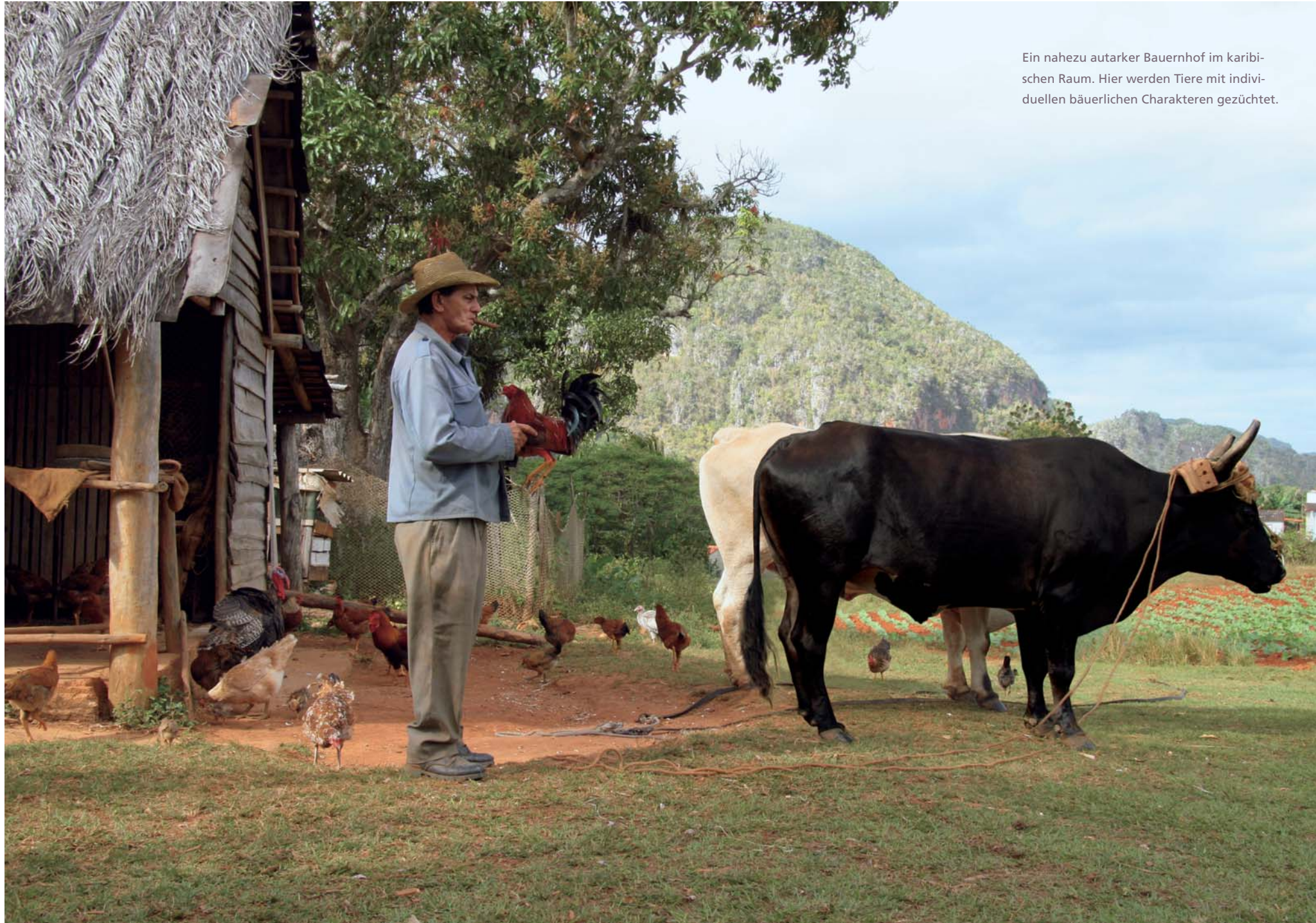
Ein nahezu autarker Bauernhof im karibischen Raum. Hier werden Tiere mit individuellen bäuerlichen Charakteren gezüchtet.