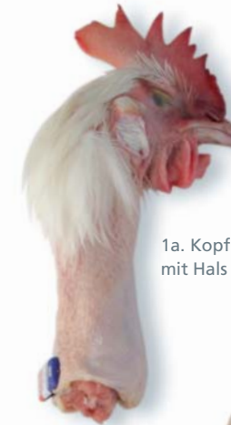
1a. Kopf mit Hals

Die Flügel am Ellenbogen abspreizen und durchtrennen. So verbleibt der Flügelknochen an der Brust des Poulets. Die Innereien mit der Hand aus der Körperhöhle entfernen, unter fließendem