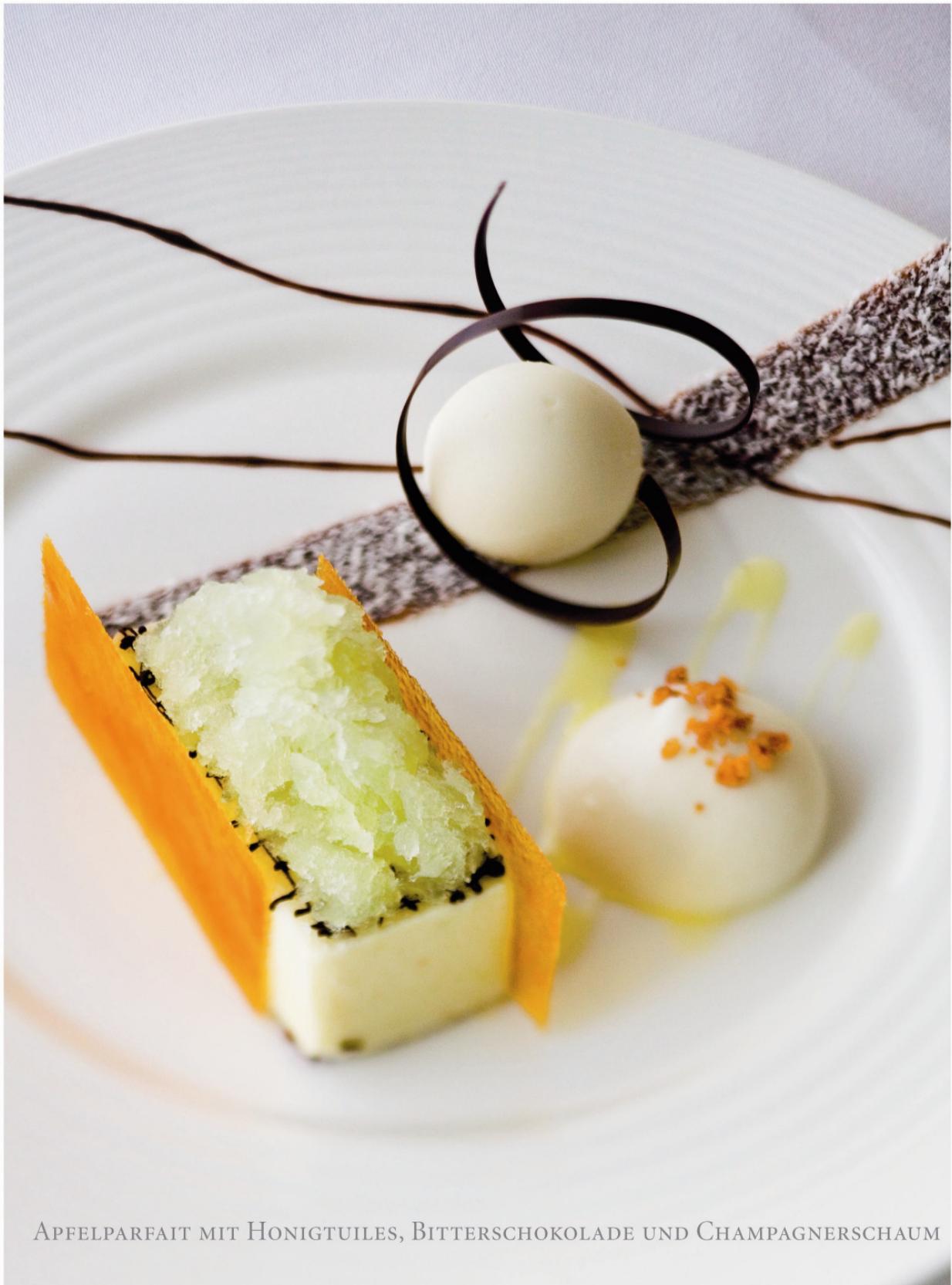
APFELPARFAIT MIT HONIGTUILES, BITTERSCHOKOLADE UND CHAMPAGNERSCHAUM