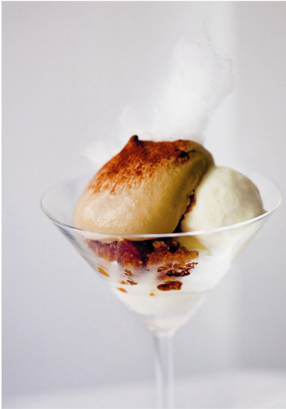
TIRAMISU MIT KAFFEEGRANITA